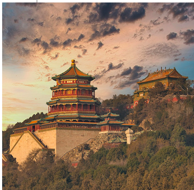
Tour di gruppo

Dalle millenarie capitali imperiali alle futuristiche metropoli