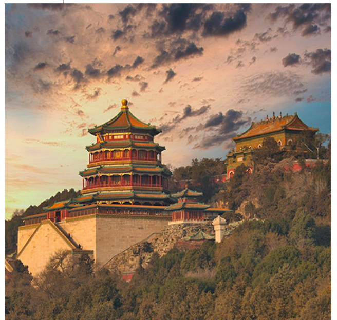
Tour di gruppo

Dalle millenarie capitali imperiali alle futuristiche metropoli