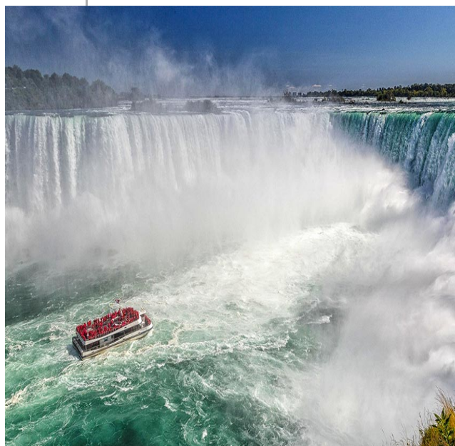
Tour di gruppo

Il meglio del nordest americano ad un prezzo imbattibile!