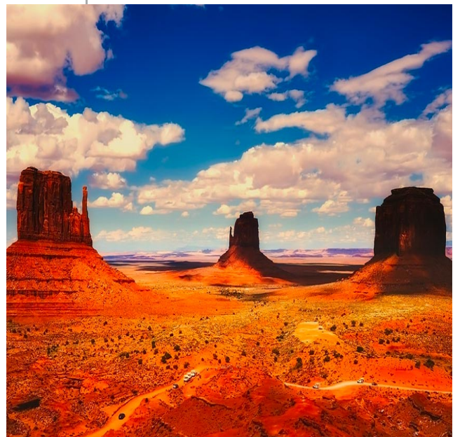
Tour di gruppo

Un'esperienza completa della costa ovest: parchi nazionali e città spettacolari!